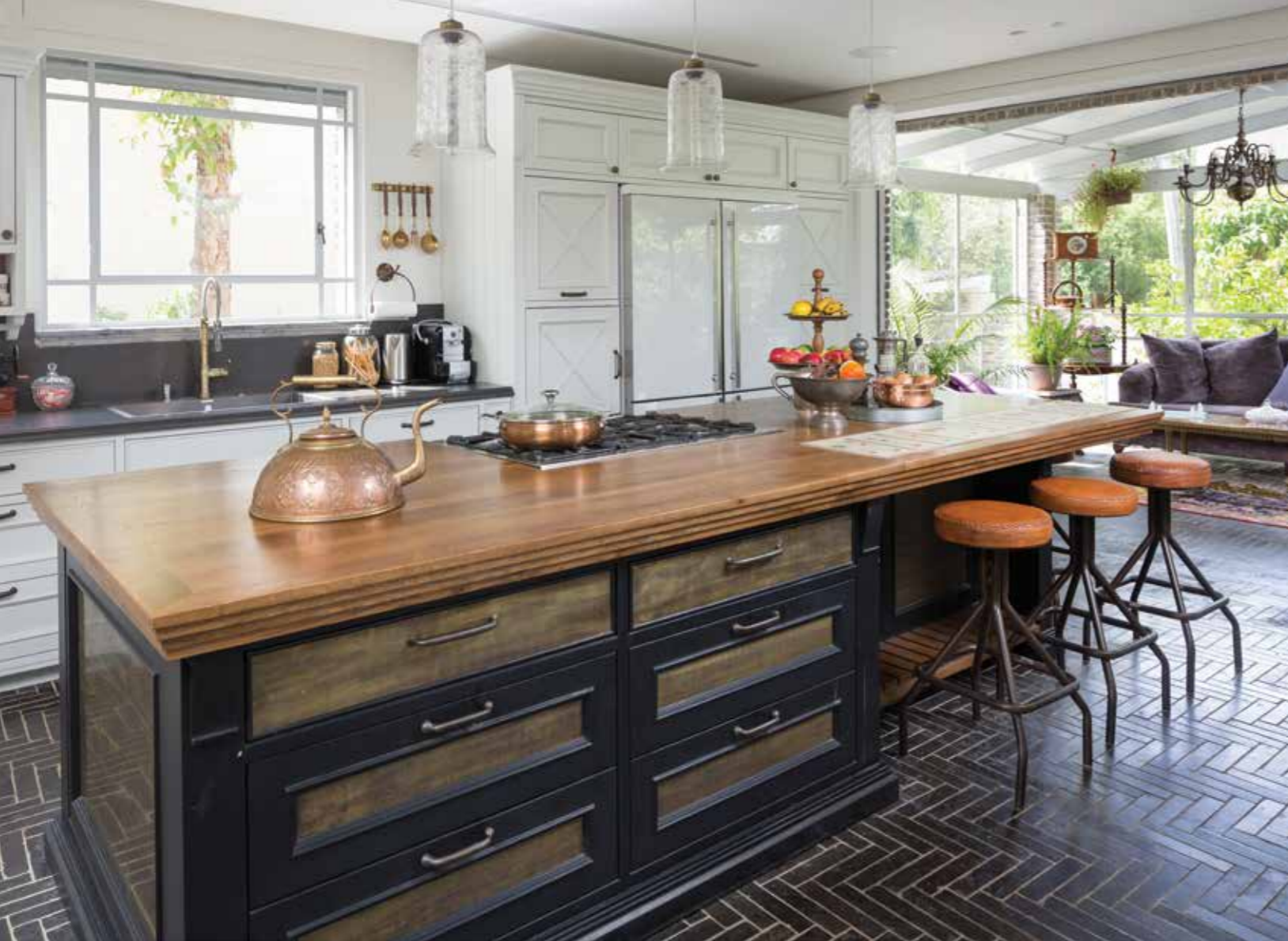
את פינת הישיבה הסלונית הוציא פרנס למרפסת סגורה, כביכול, למעשה זהו חדר הסגור בשלושה כיוונים על ידי קירות זכוכית. הסלון פונה לחזית הכניסה לבית ונראה כטבול בתוך הצמחייה